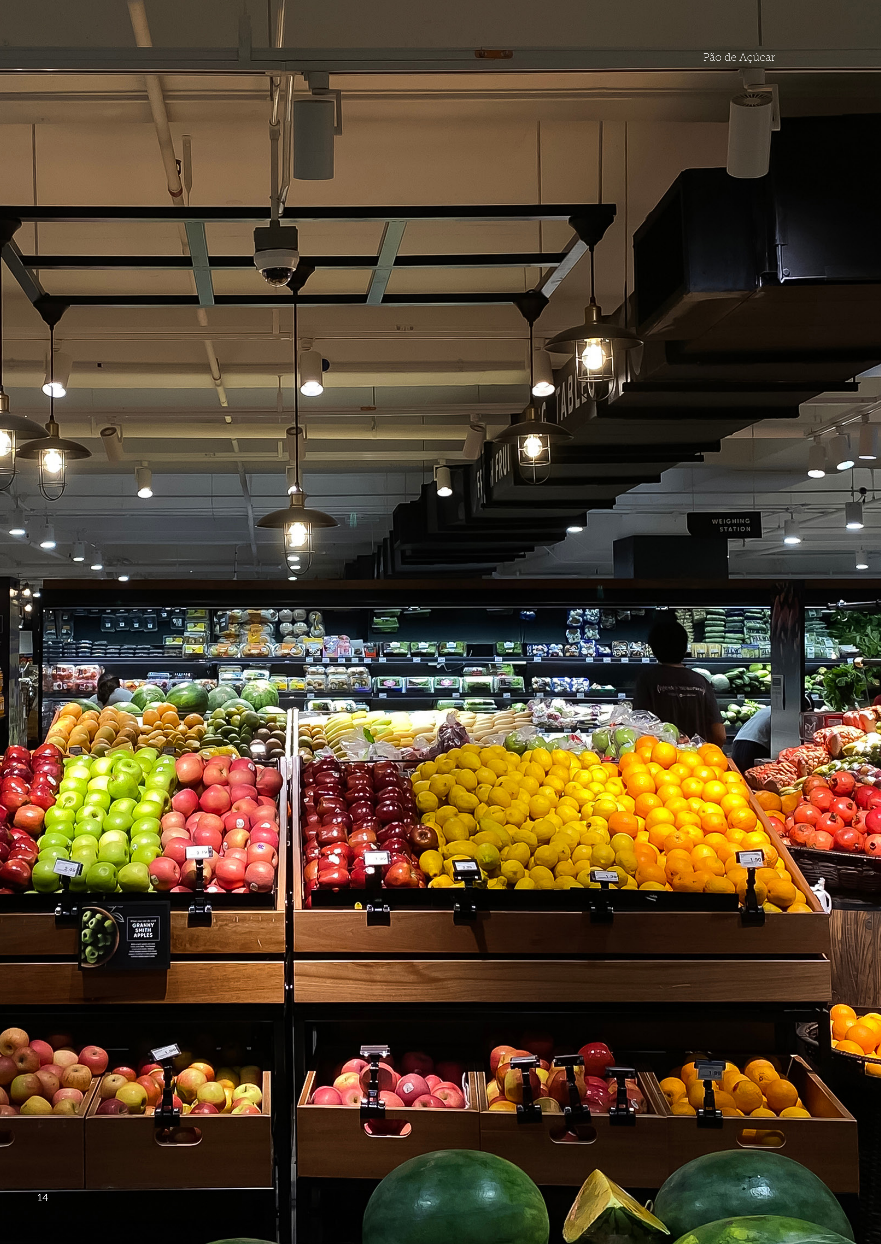
Pão de Açúcar