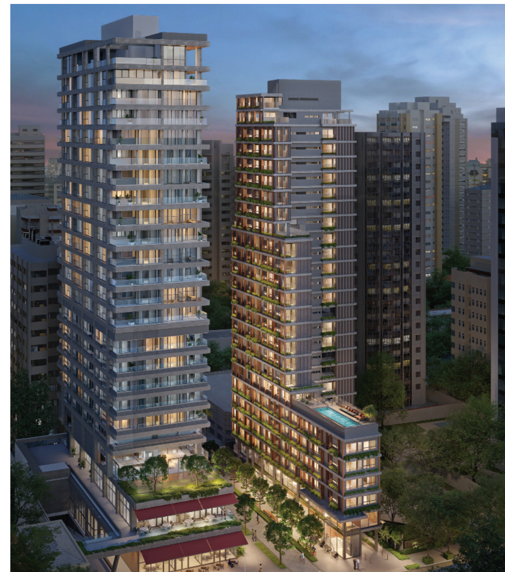
155 E 177 JERÔNIMO