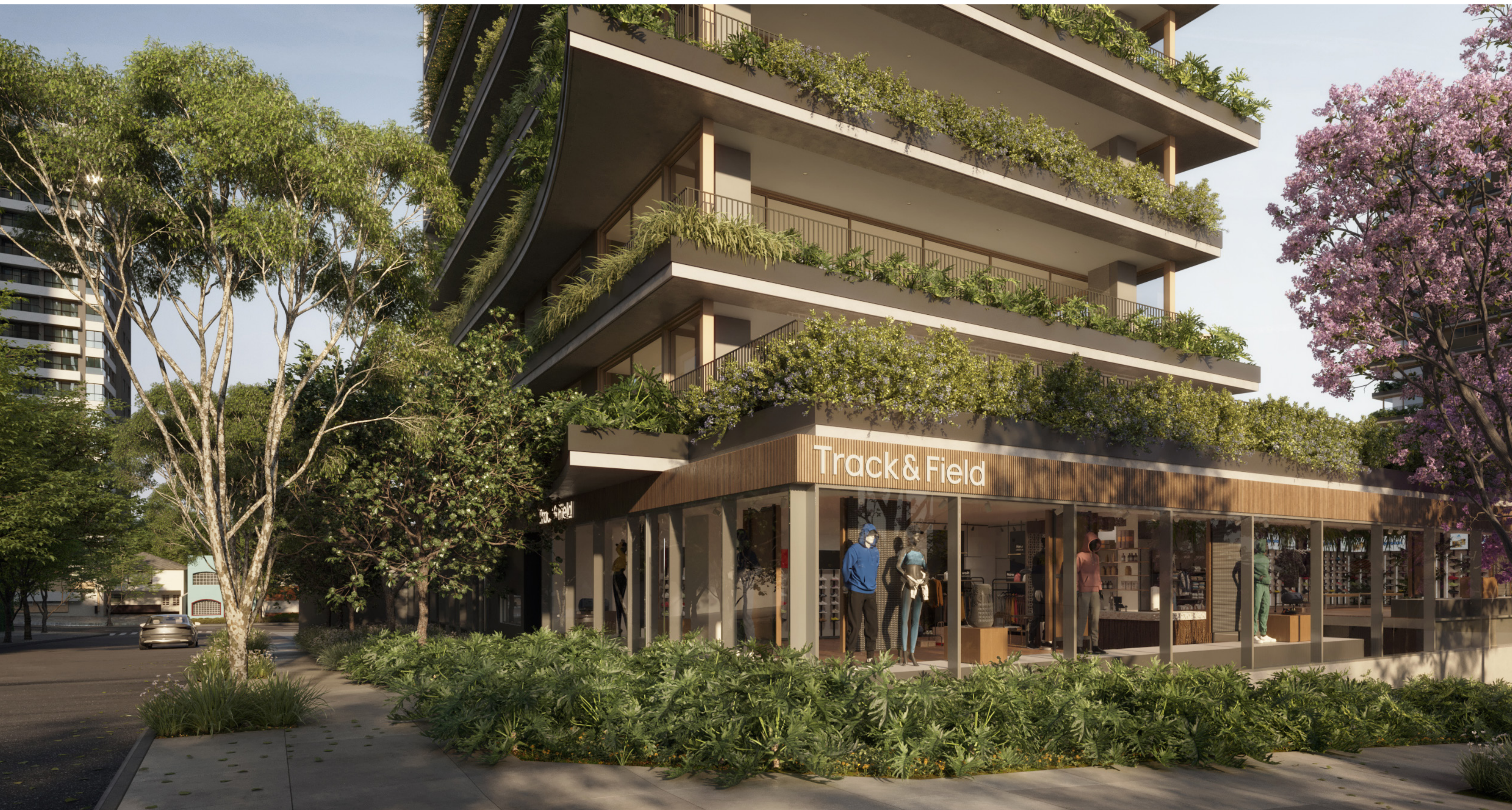
TF STORE e TF CAFÉ Acesso permanente à plataforma TF Sports