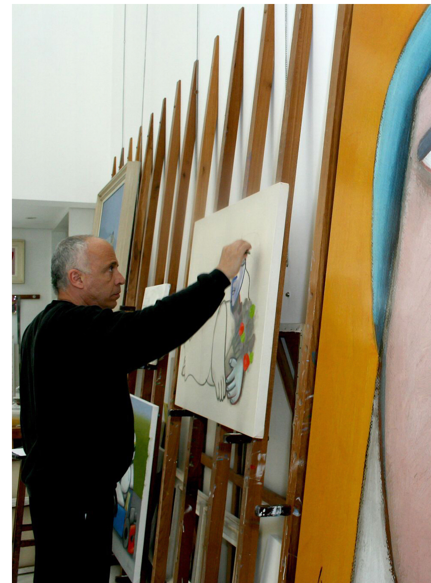
Instituto Gustavo Rosa

Entrar em uma galeria, é abrir uma porta para o inesperado. É aceitar o convite de se perder por instantes e se reencontrar em formas, cores e ideias. É experimentar o bairro por outro ângulo.