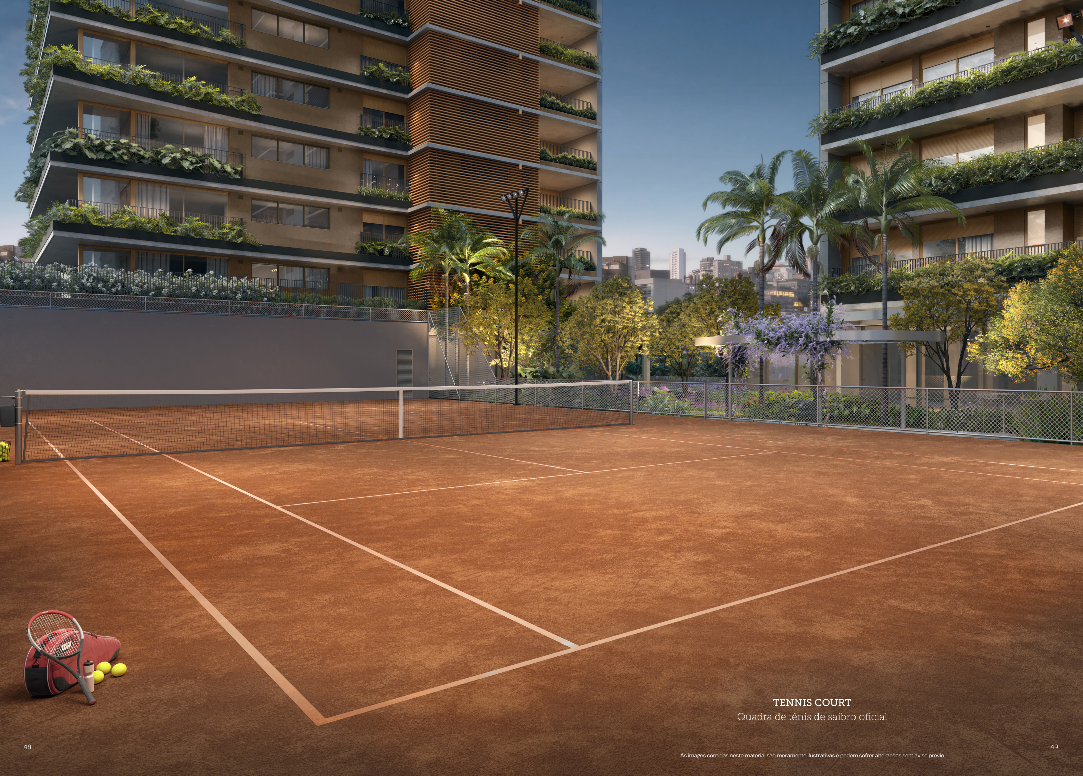
TENNIS COURT Quadra de tênis de saibro oficial