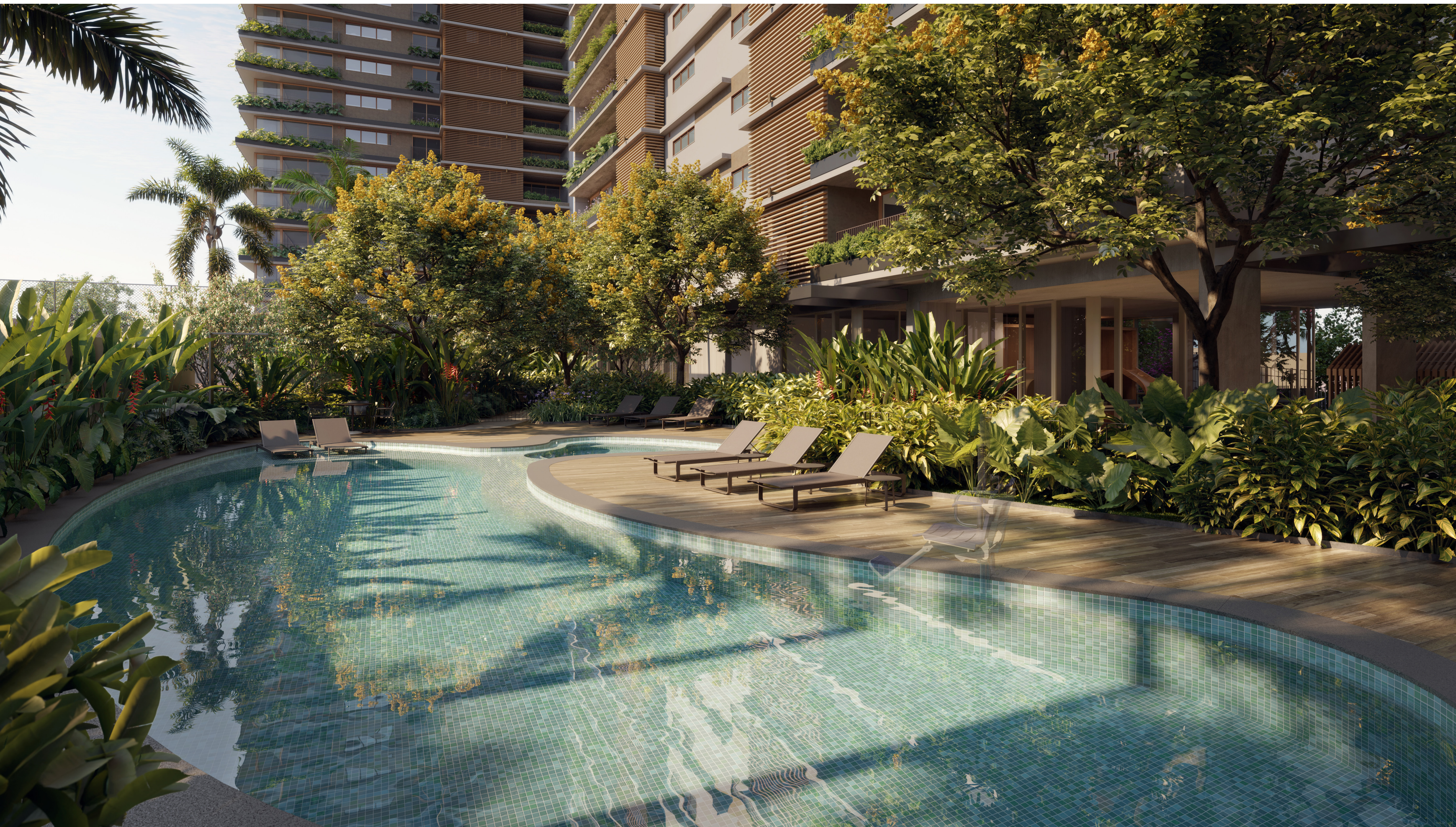
OUTDOOR POOL Design orgânico