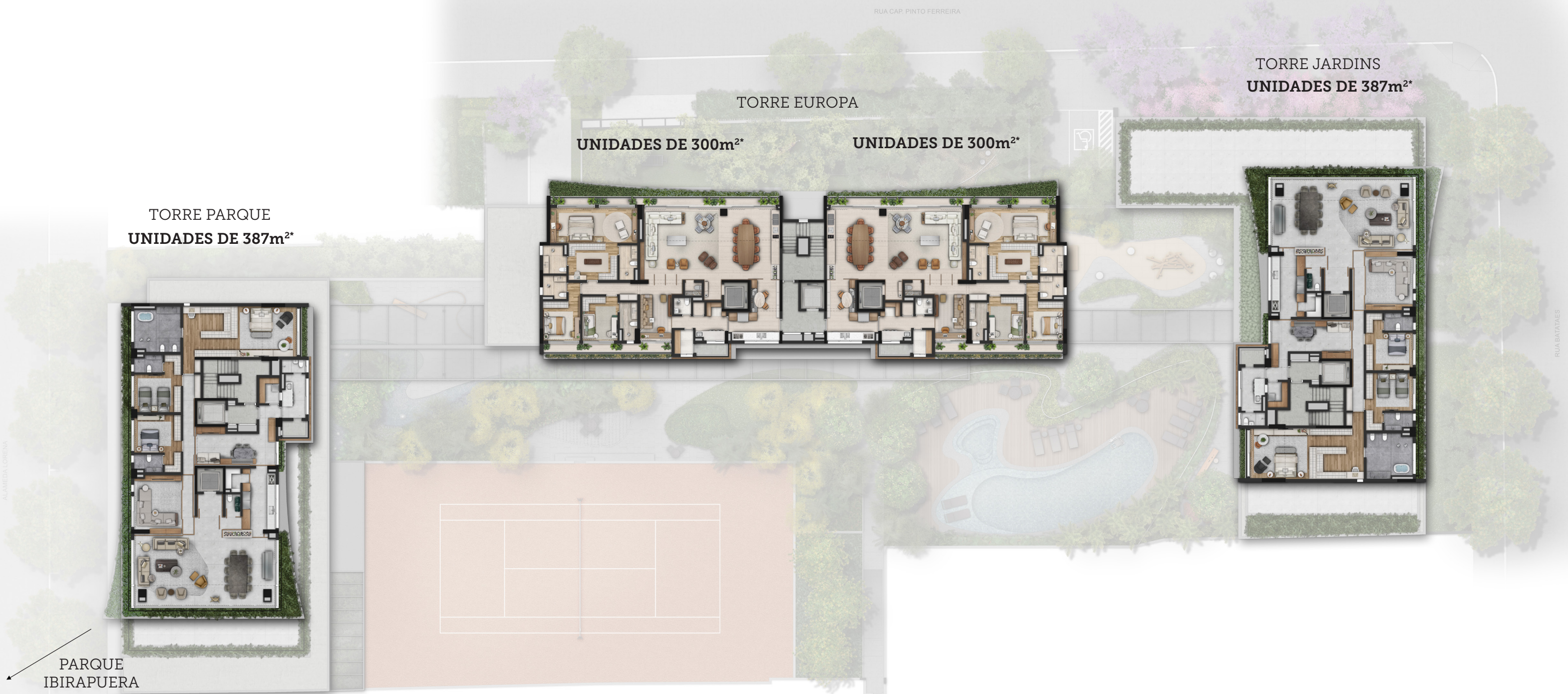
TORRE PARQUE UNIDADES DE 387m 2*