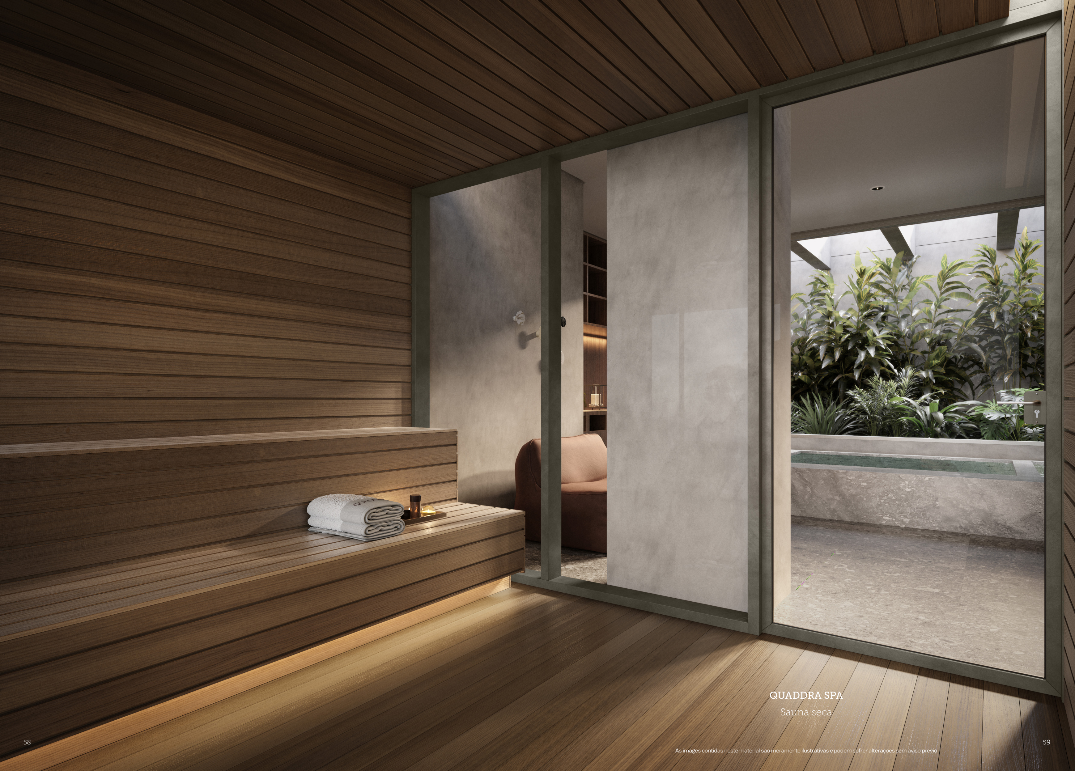
QUADDRA SPA Sauna seca