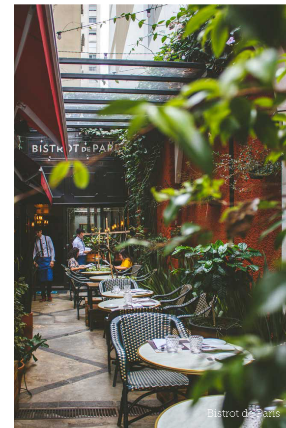
Bistrot de Paris