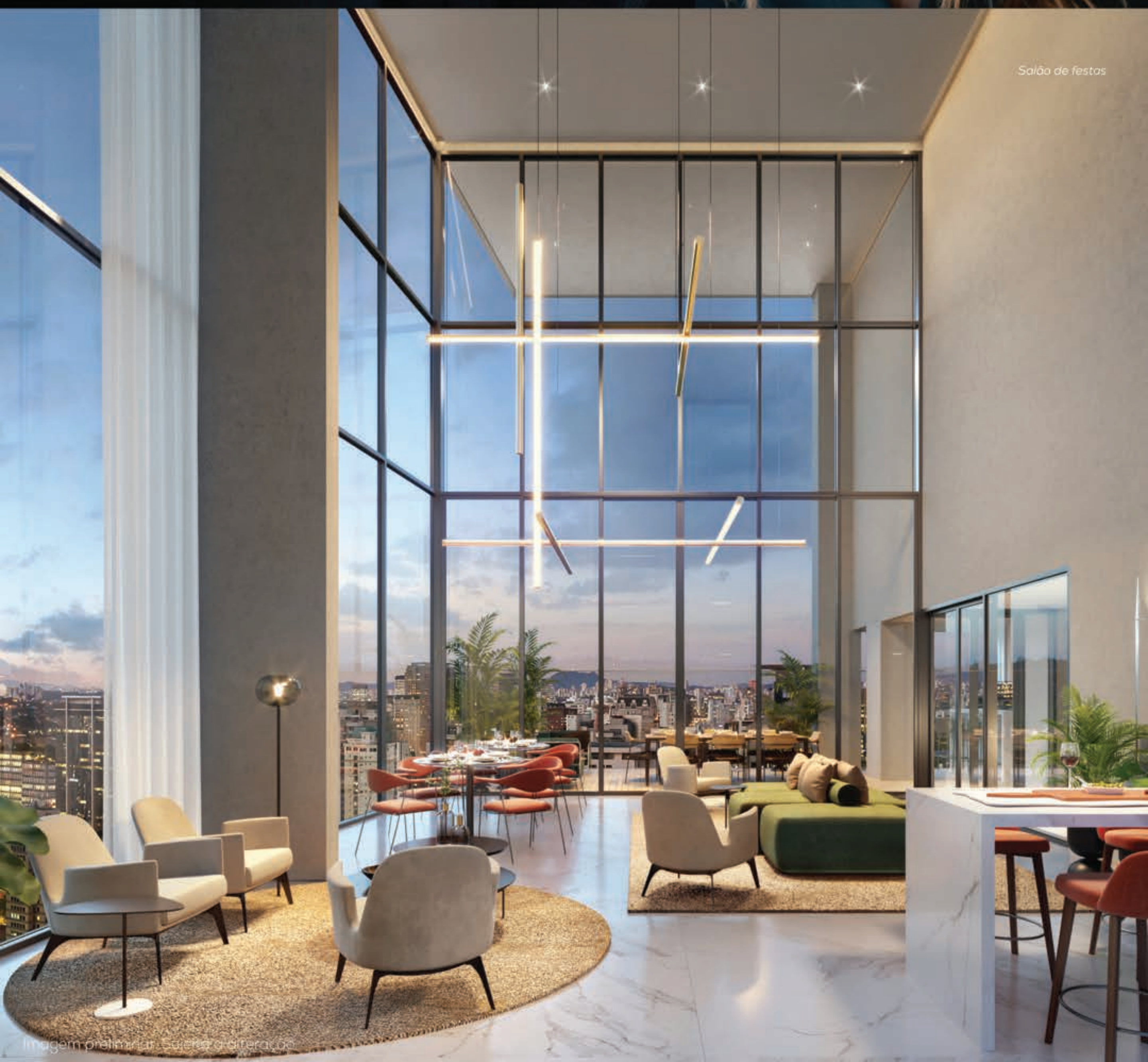
Salão de festas