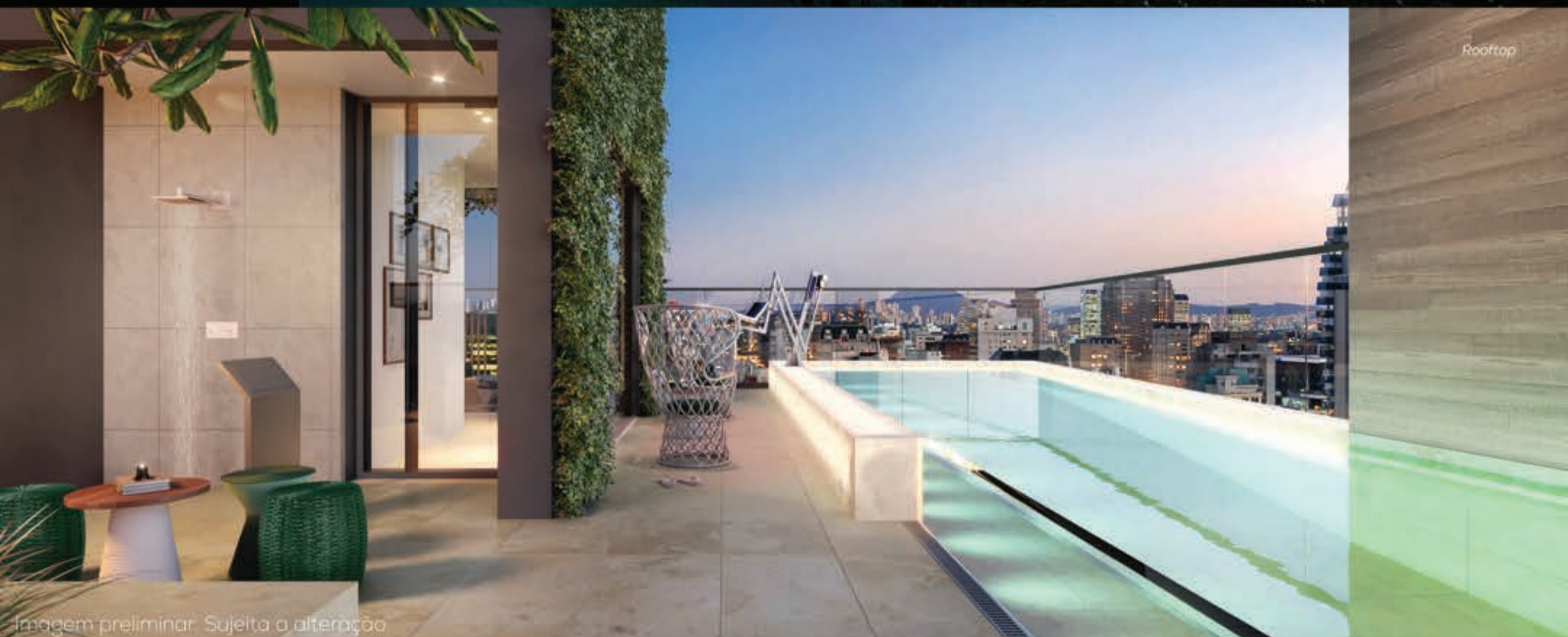
Imagem preliminar. Sujeita a alteração

A natureza do material como textura traz um caráter etéreo, construindo a identidade deste novo ícone no skyline paulistano.