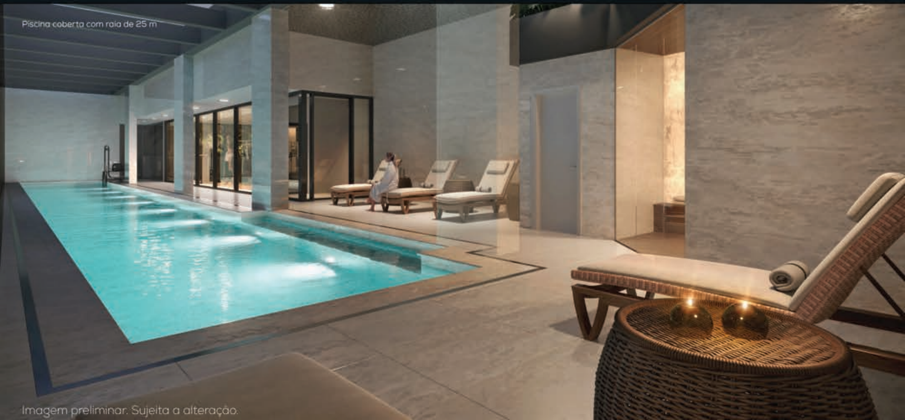
Piscina coberta com raia de 25 m

aconchegante e extremamente sofisticada. Funcional, ela é adaptada de acordo com os usos dos espaços, seja para relaxar, seja para se exercitar.