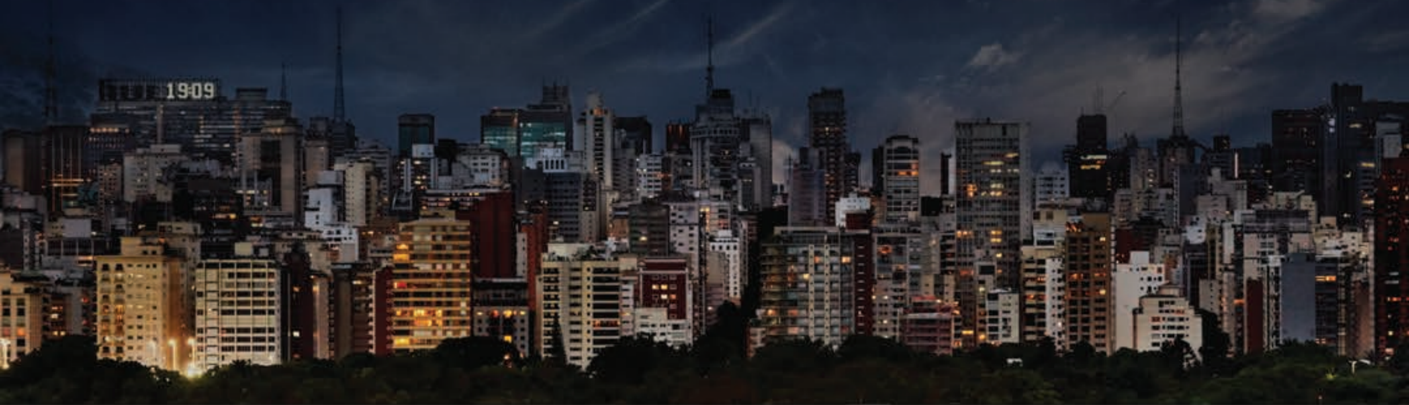
Imagem panorâmica da região.

SKYLINE: Mire o skyline da Av. Paulista e da Av. Faria Lima e respire todo o verde do Jd. Europa, na sala da sua casa.