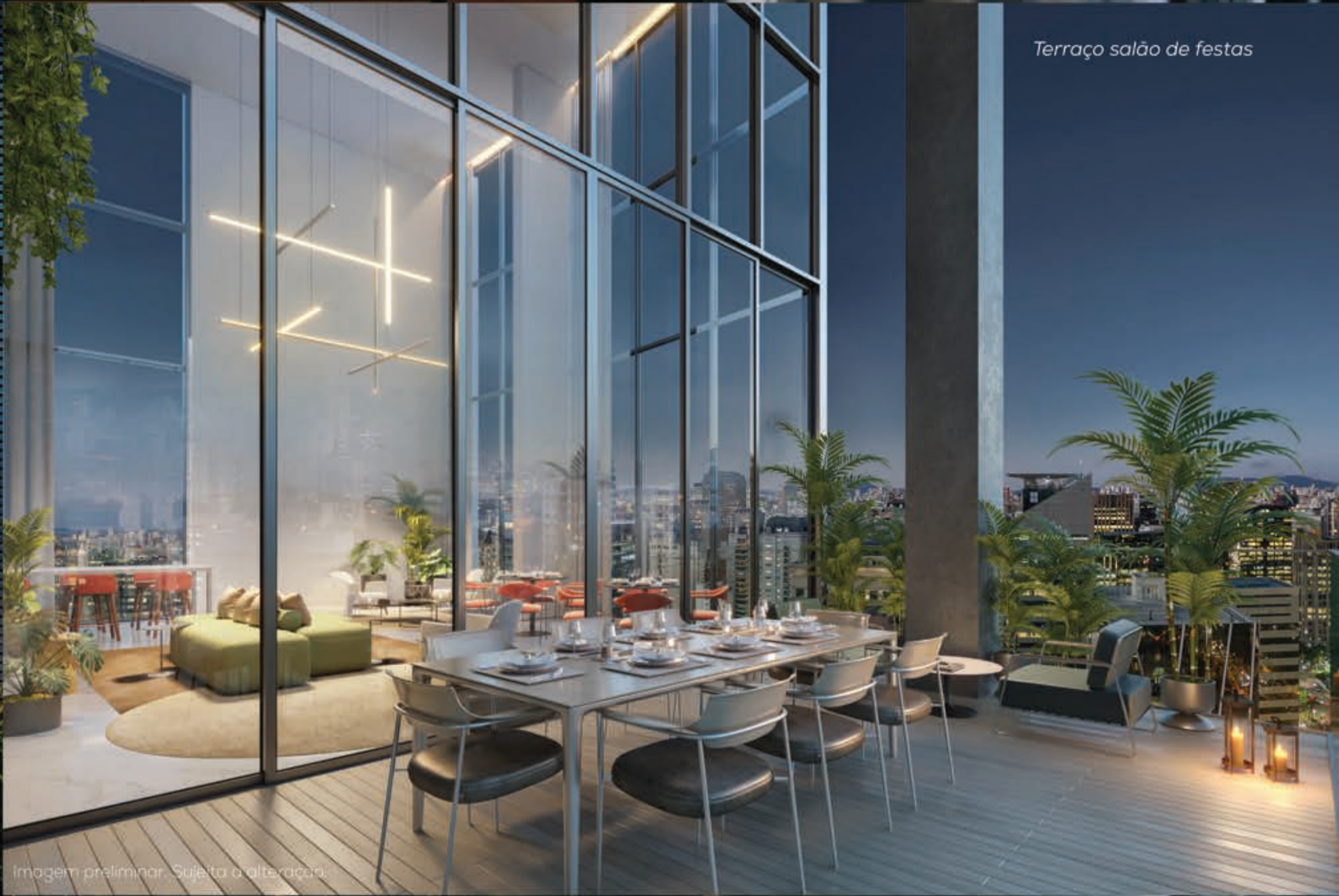
Terraço salão de festas