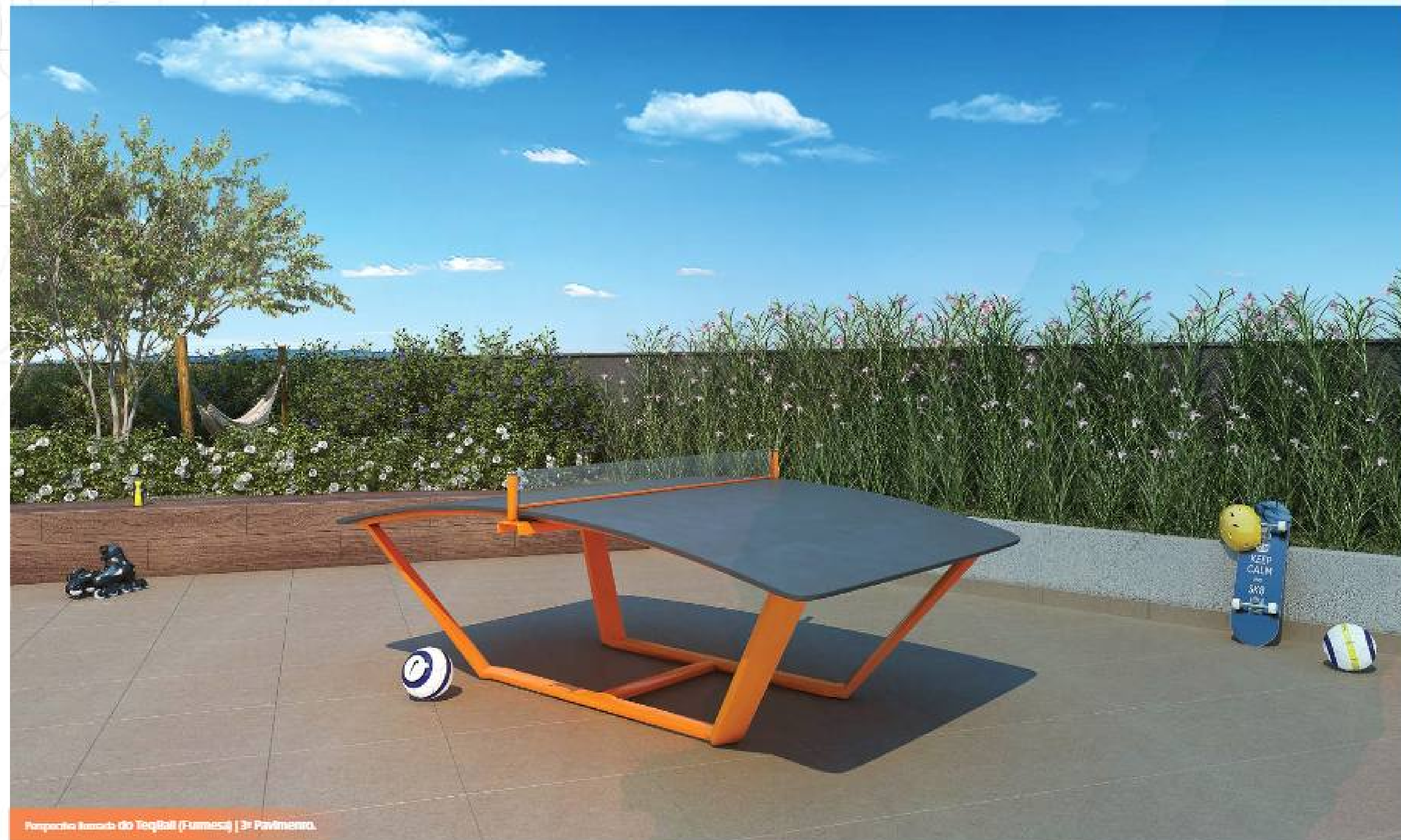
Parque Karada do Teqball (Fumesa) | 3ª Pavimento.