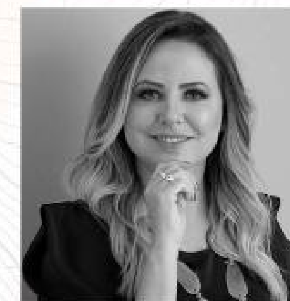
roberta ventura ARQUITETURA & PAISAGISMO

Com atuação no mercado imobiliário desde 2009, o escritório traz uma vasta experiência de mercado, associando à arquitetura o padrão de vida contemporânea, atendendo expectativas de clientes e fazendo da arquitetura não só um trabalho, mas uma paixão.