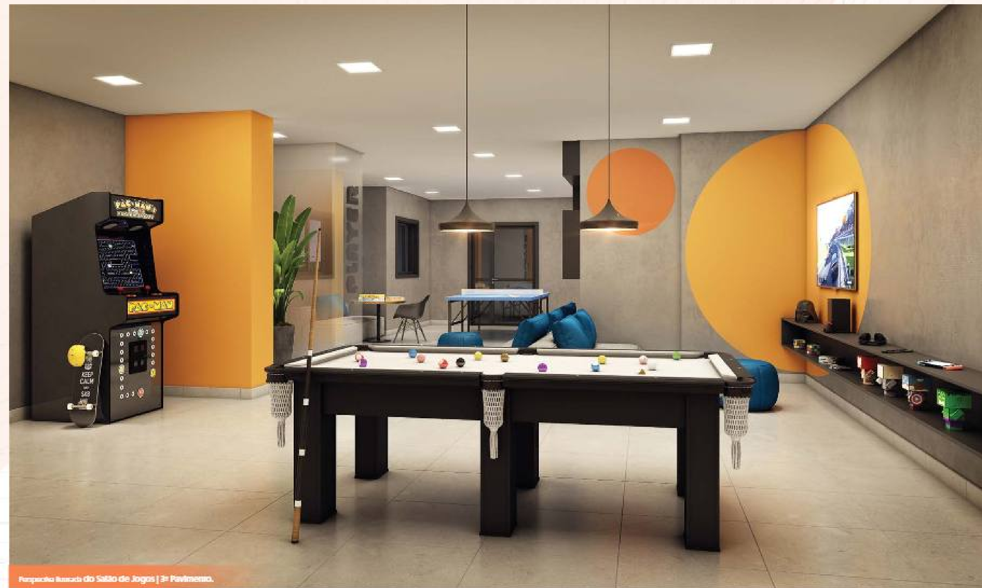
Perímetro Ilustrado do Salão de Jogos | 3º Pavimento.

DIVIRTA-SE COM ELEGÂNCIA E ESTILO EM NOSSOS ESPAÇOS EXCLUSIVOS.