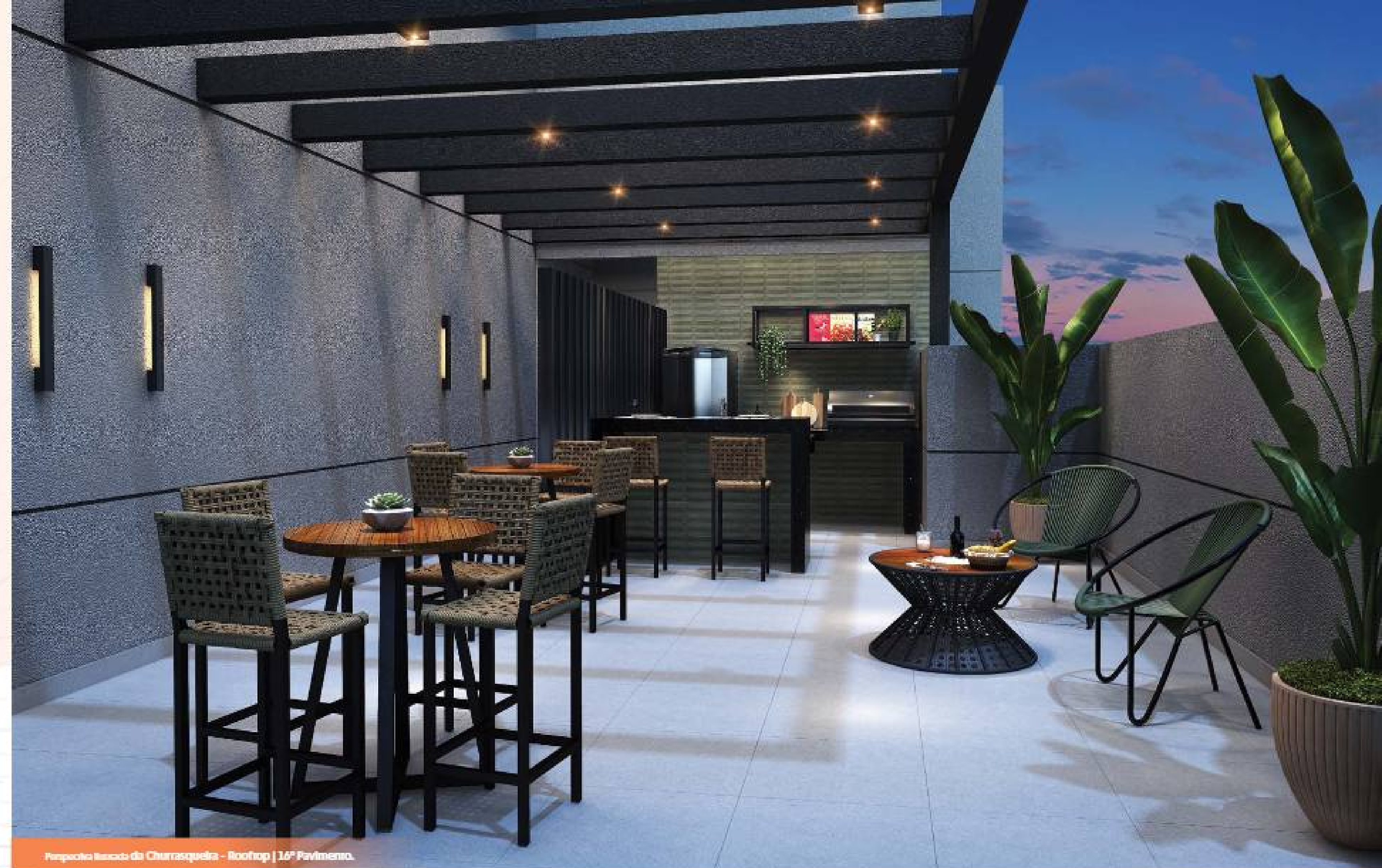
Perpiche Itacoba da Churrasqueira - Rooftop | 16º Pavimento.