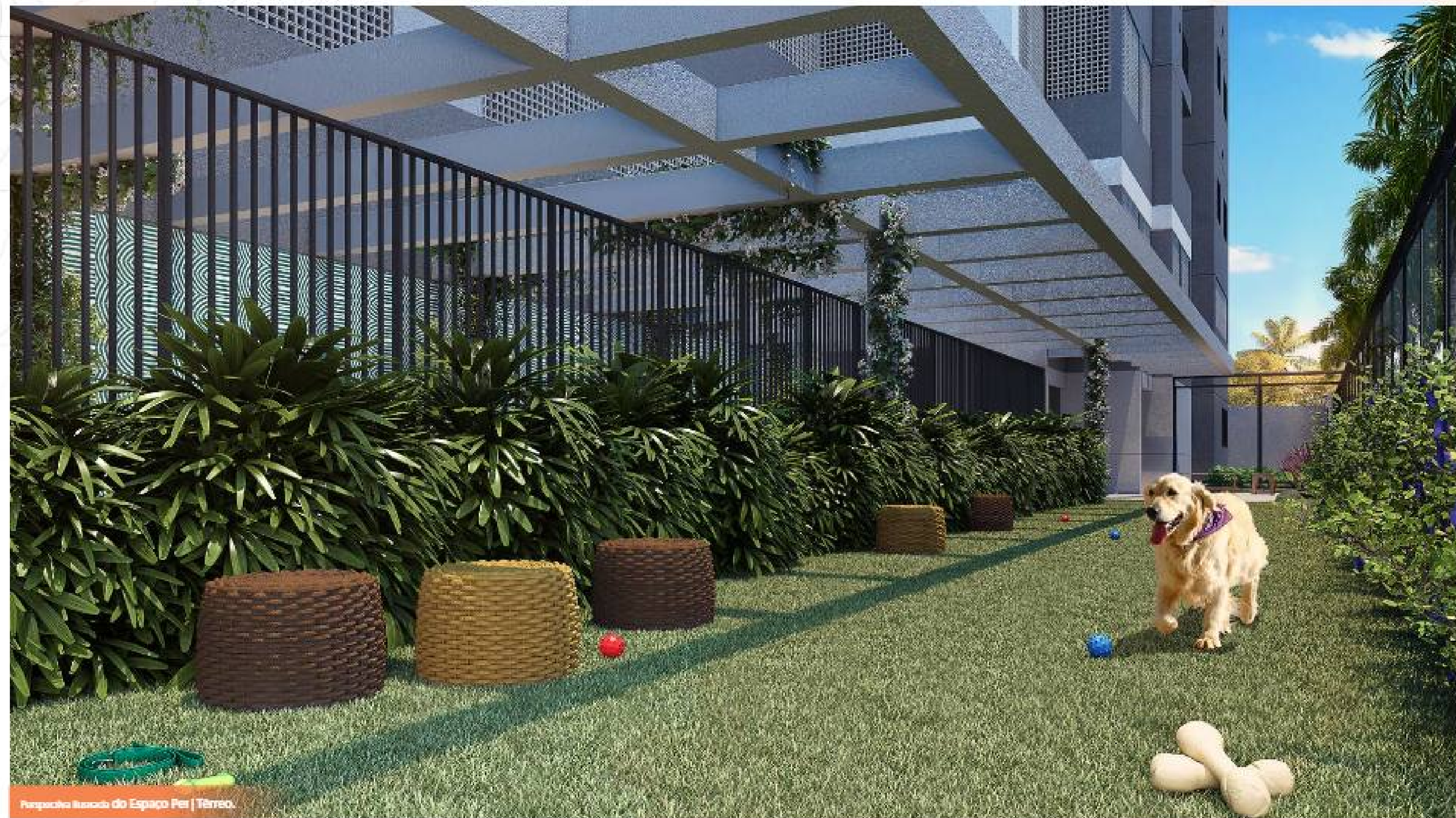
Perspectiva Ilustrada do Espaço Pet | Térreo.