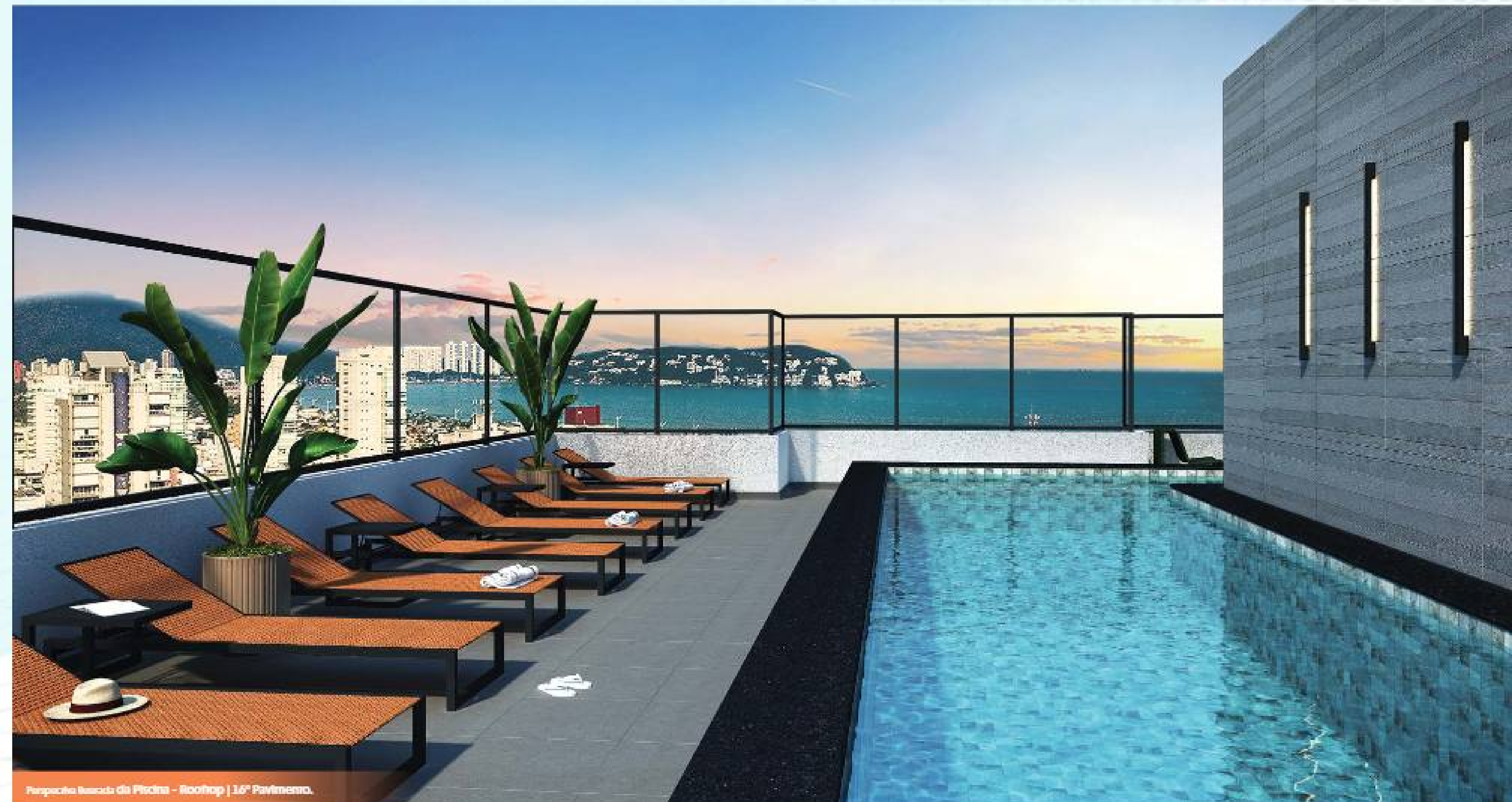
Perspectiva Ilustrada da Piscina - Rooftop | 16º Pavimento.