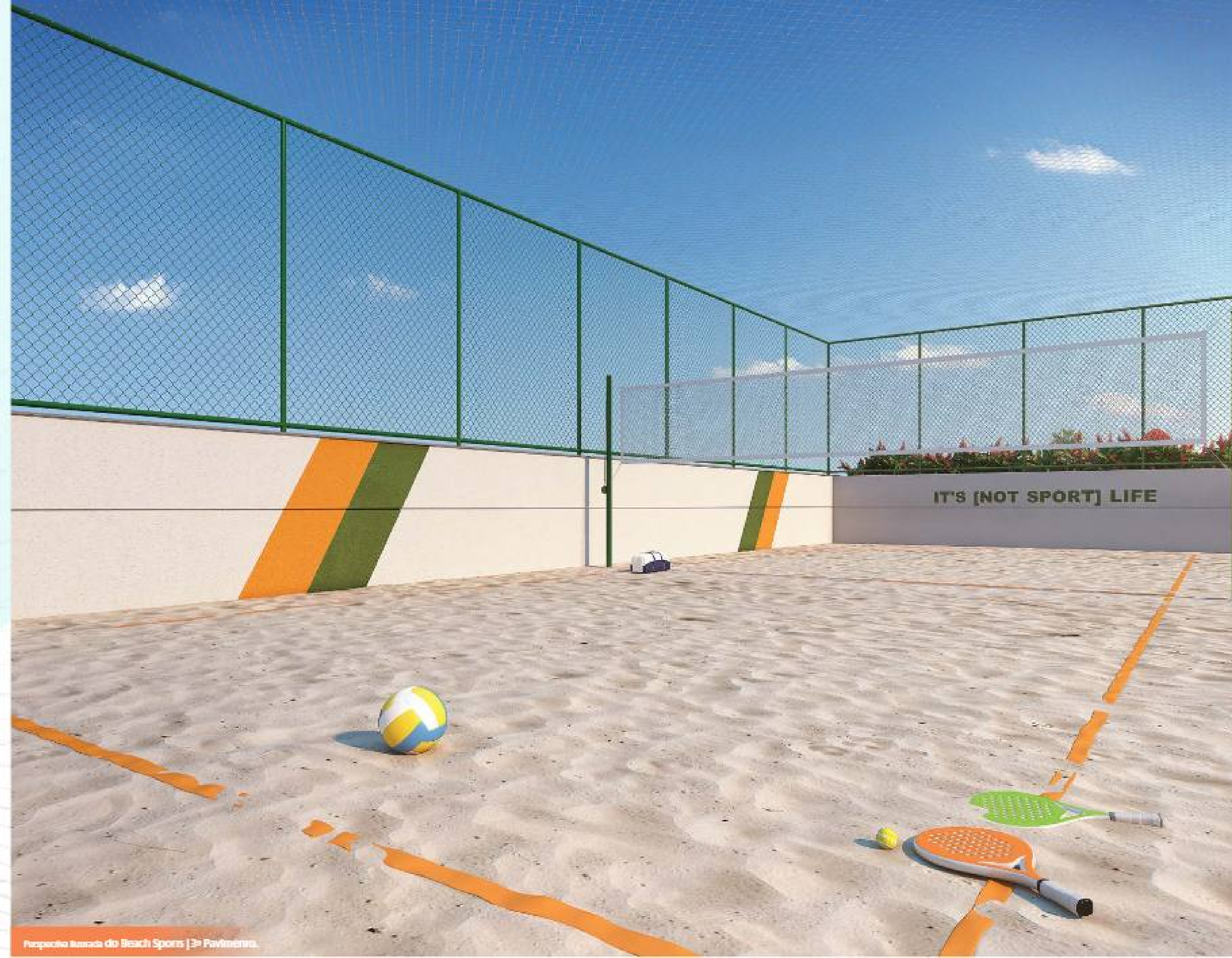
Parque Karada do Beach Sports | 3ª Pavimento.