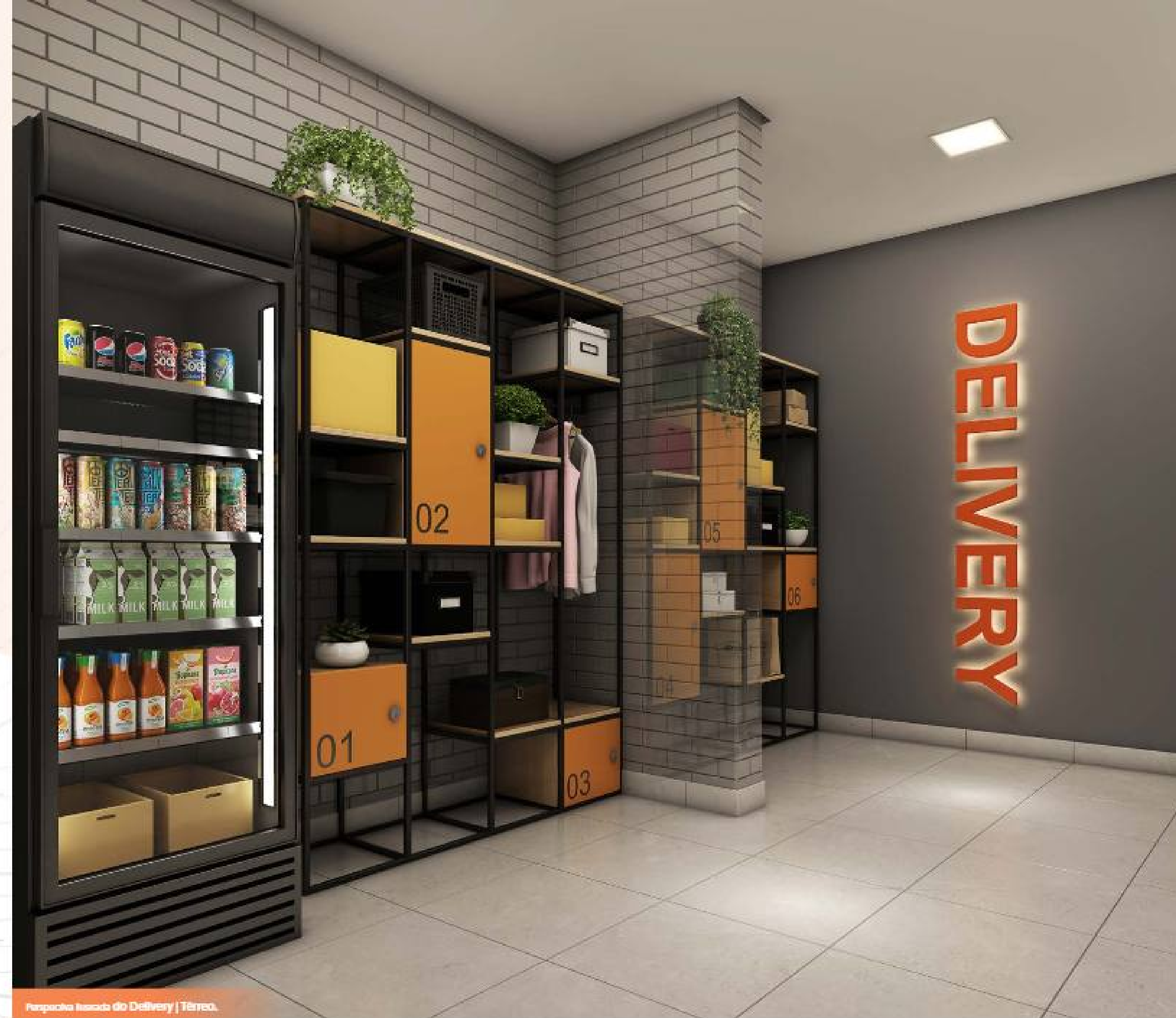
Perspectiva Ilustrada do Delivery | Térreo.