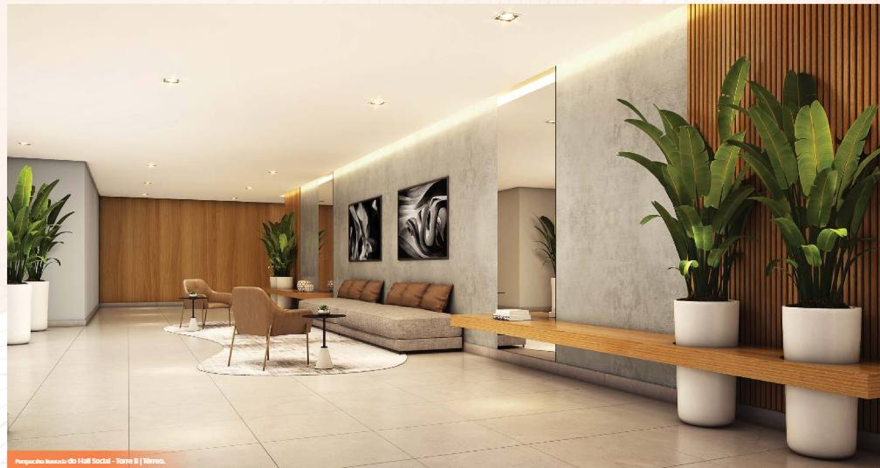
Percepção Ilustrada do Hall Social - Torre B | Térreo.