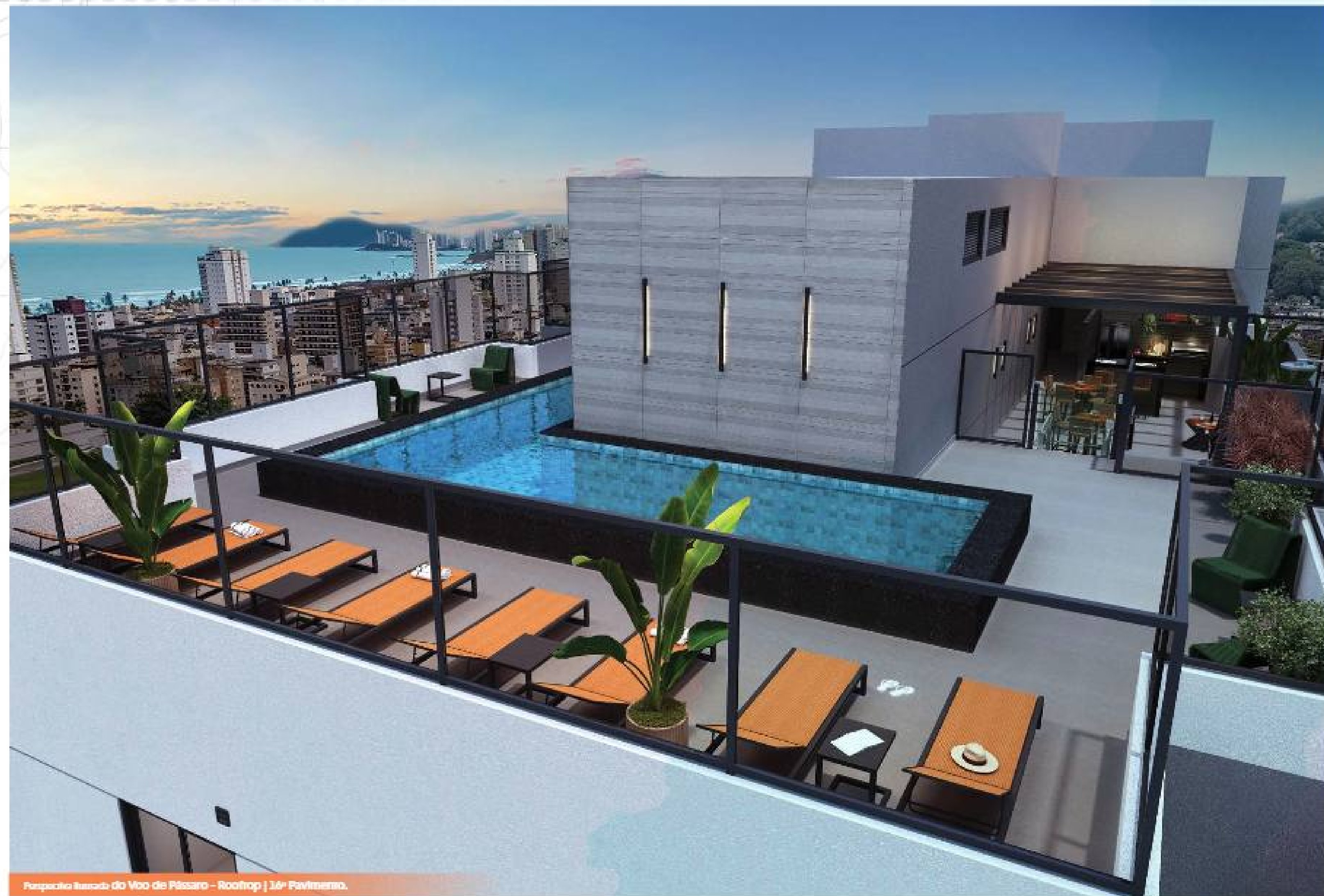
Perspectiva Ilustrada do Voo de Péssaro - Rooftop | 16º Pavimento.