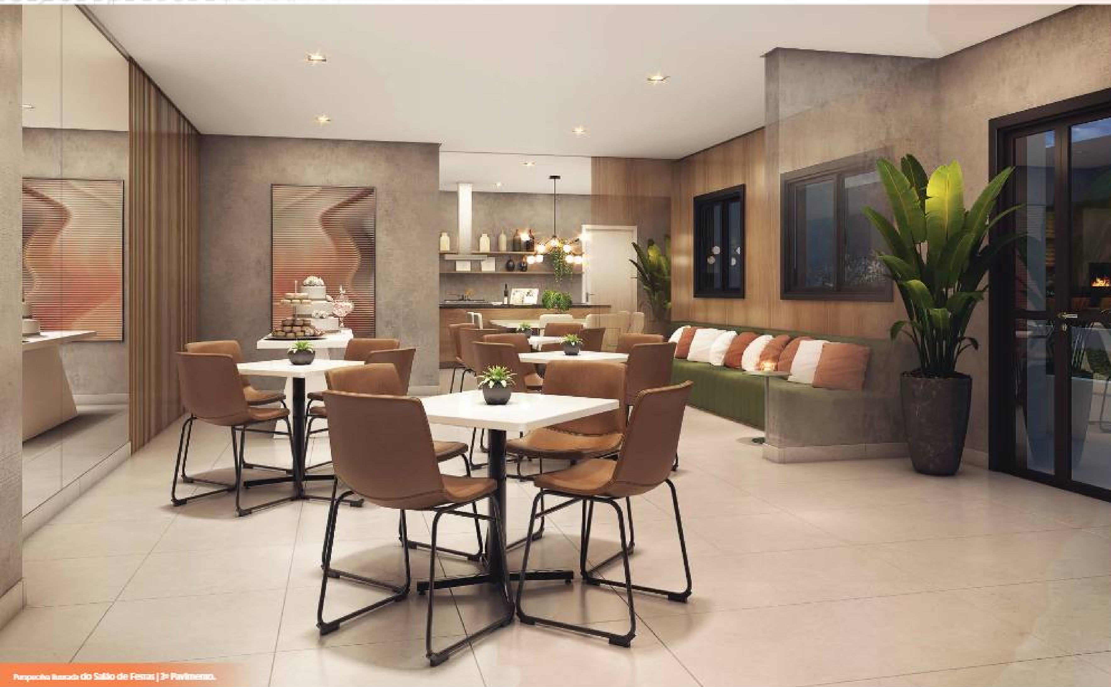
Perímetro Ilustrado do Salão de Festas | 3º Pavimento.