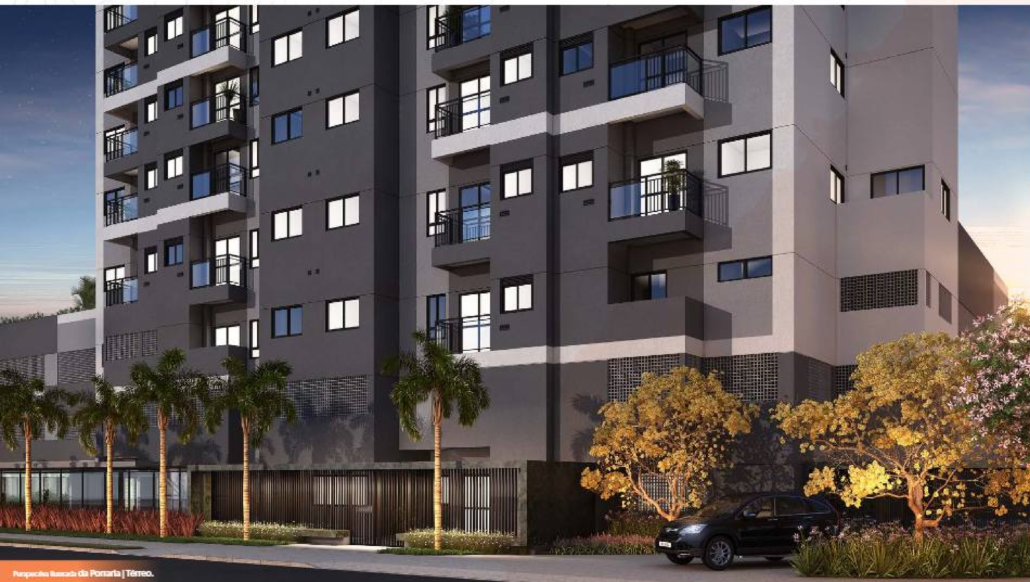
Percepção Ilustrada da Portaria | Térreo.