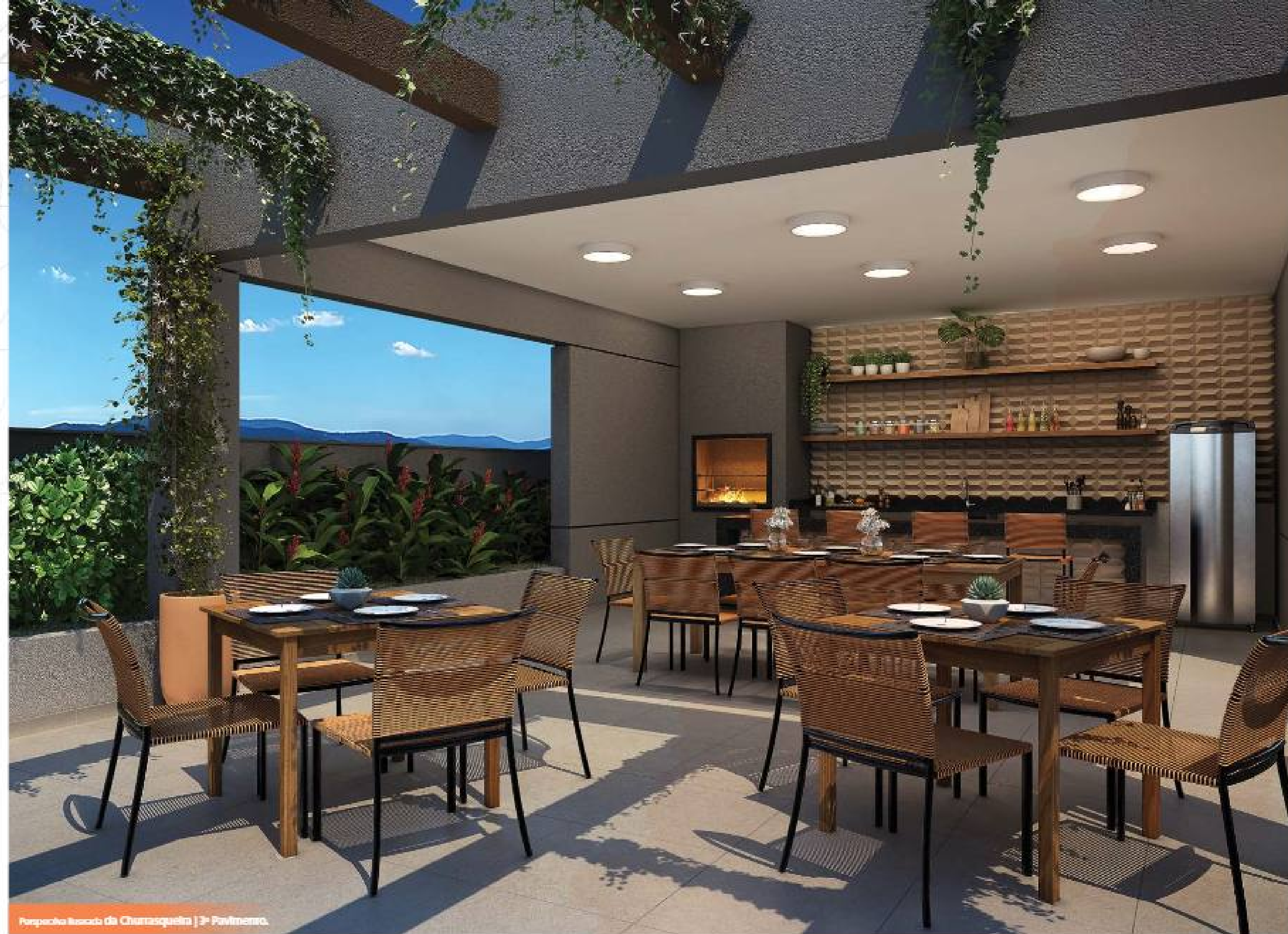
Perpiche Itacoba da Churrasqueira | 3º Pavimento.