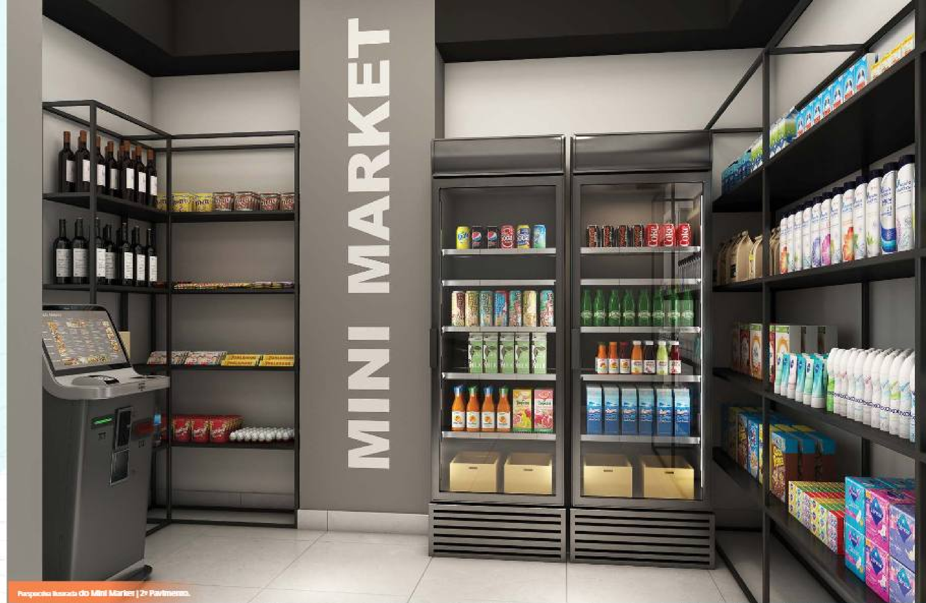
Perspectiva interna do Mini Market | 2º Pavimento.