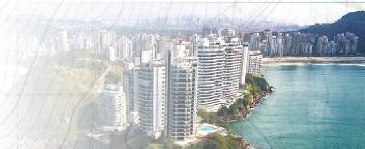
Foto aérea da região.

O terreno faz parte do Guarujá Central Park, bairro planejado pela Sobloco na praia da Enseada. Uma extensa área desenvolvida para gerar equilíbrio ecológico, segurança e valorização, se estendendo da frente do mar até uma área de preservação permanente junto à serra.