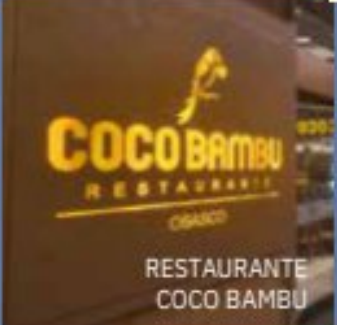
RESTAURANTE COCO BAMBU