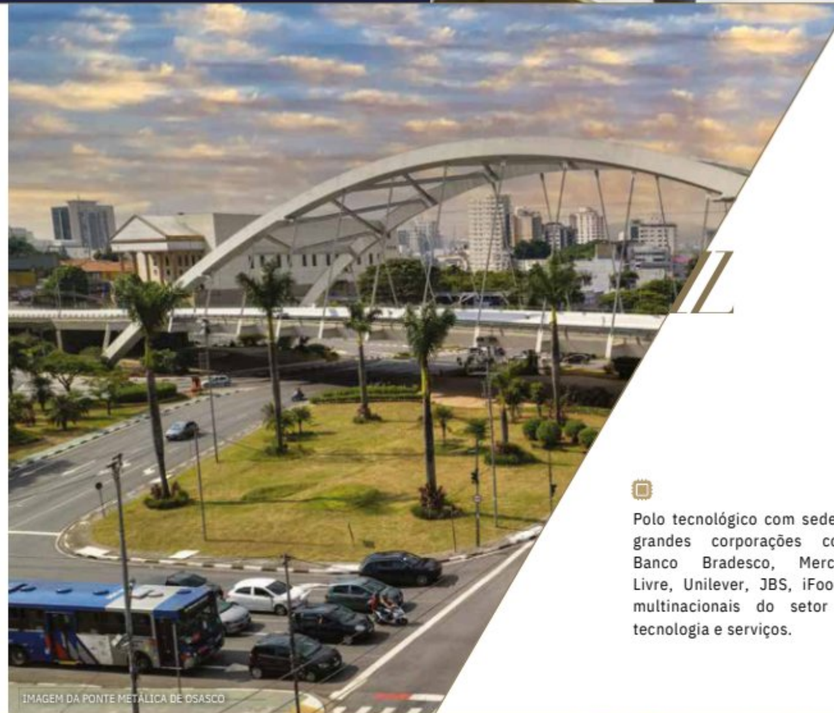
IMAGEM DA PONTE METÁLICA DE OSASCO

Nesse contexto, o Azzure se posiciona como parte do novo capítulo urbano, com padrão que tende a ser mais procurado.