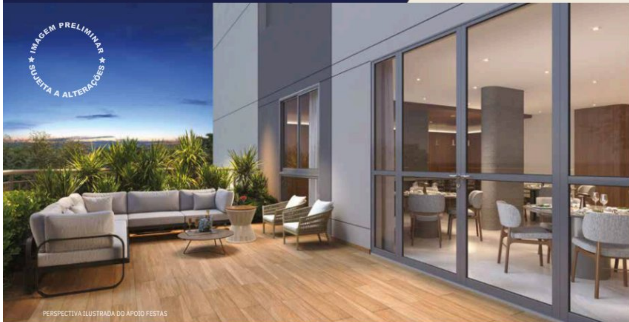
PERSPECTIVA ILUSTRADA DO APOIO FESTAS

Um salão de festas à altura das suas celebrações.