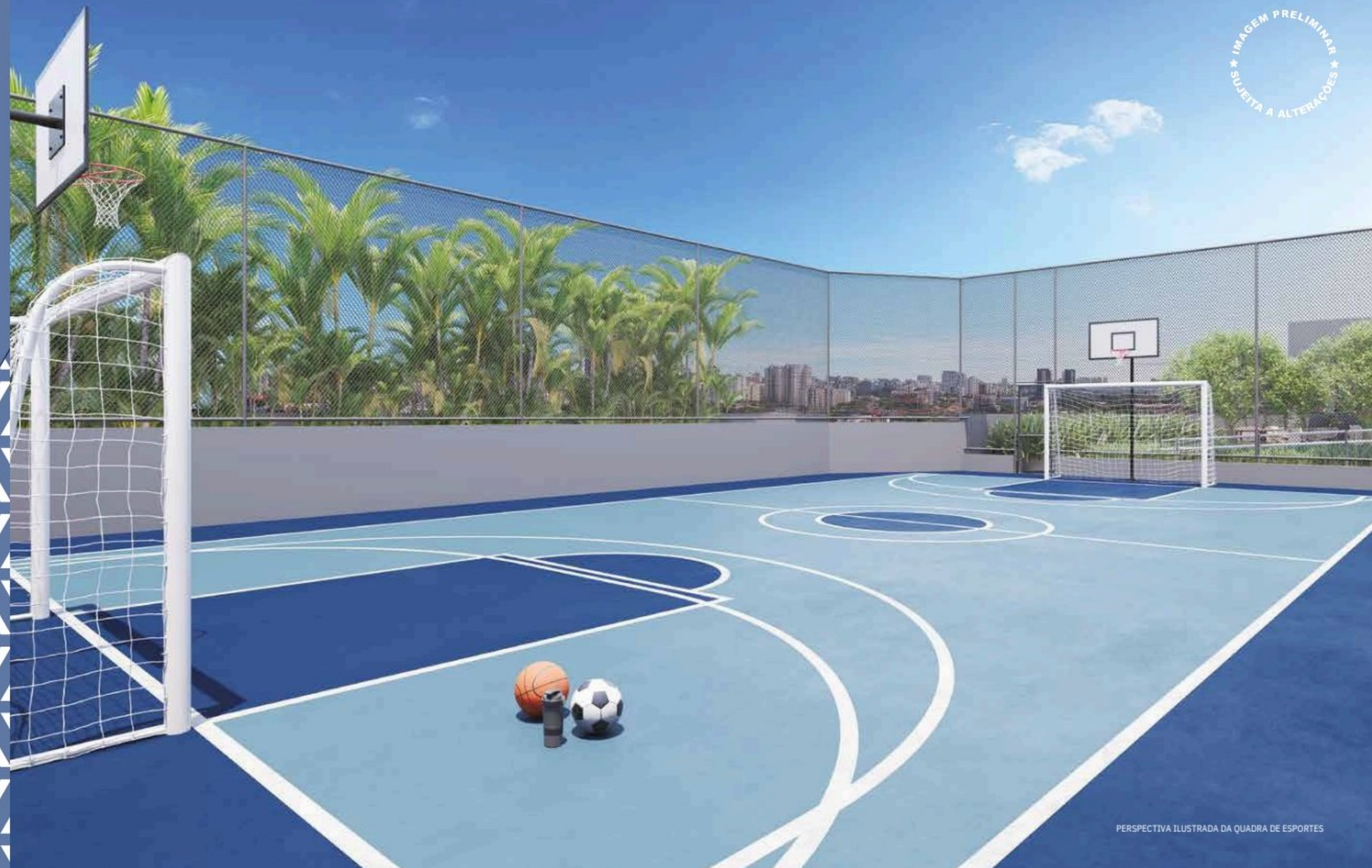
PERSPECTIVA ILUSTRADA DA QUADRA DE ESPORTES

Da prática ao lazer, uma quadra de esportes feita para m o v i m e n t a r