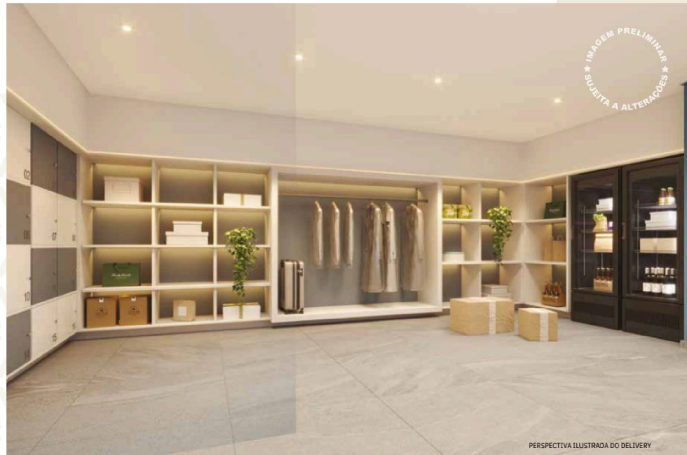
PERSPECTIVA ILUSTRADA DO DELIVERY

MINIMARKET - ESTE SERVIÇO SERÁ ENTREGUE POR TERCEIROS, CONFORME CONVENÇÃO, A CRITÉRIO DO CONDOMÍNIO. ESTE AMBIENTE PODERÁ SOFRER ALTERAÇÃO.