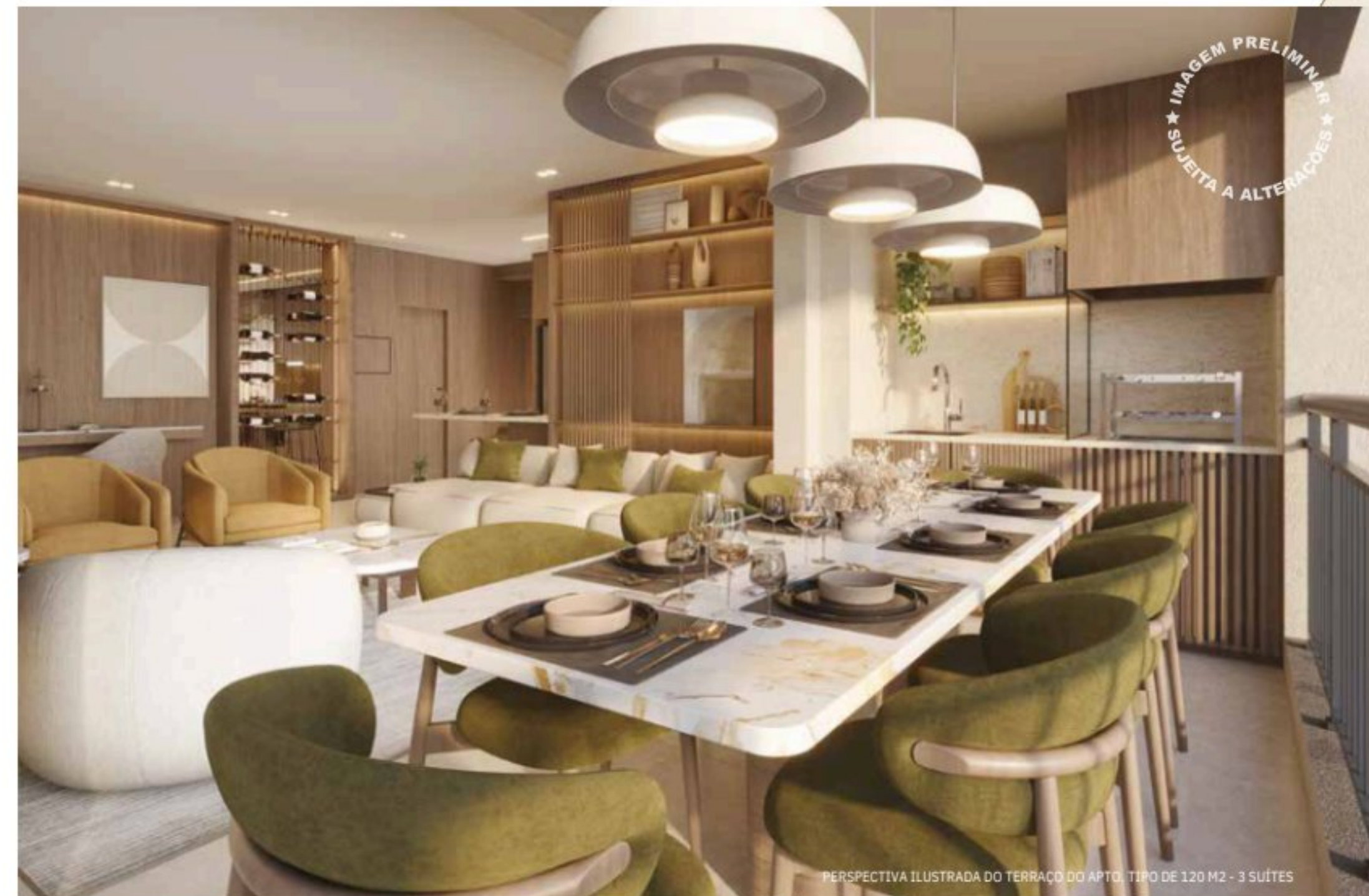
PERSPECTIVA ILUSTRADA DO TERRAÇO DO APTO. TIPO DE 120 M 2 - 3 SUÍTES

SUGESTÃO DE DECORAÇÃO. EVENTUAIS ADEQUAÇÕES NAS INSTALAÇÕES ELÉTRICAS E/OU HIDRÁULICAS SERÃO POR CONTA DOS CLIENTES. QUALQUER MODIFICAÇÃO NO APARTAMENTO QUE IMPLIQUE NA ALTERAÇÃO DO PROJETO ORIGINAL DA FACHADA DEVERÁ SER APROVADA EM ASSEMBLEIA DO CONDOMÍNIO. SERÁ ENTREGUE CAIXILHO ENTRE O LIVING E TERRAÇO PELA INCORPORADORA.