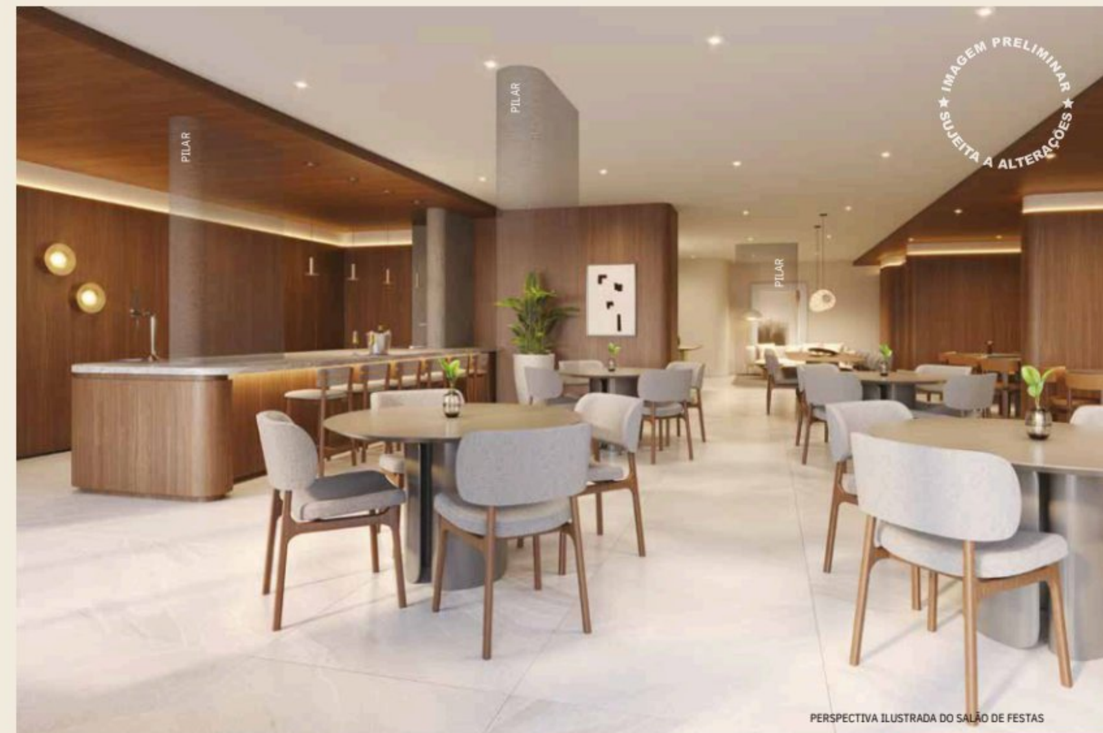
PERSPECTIVA ILUSTRADA DO SALÃO DE FESTAS