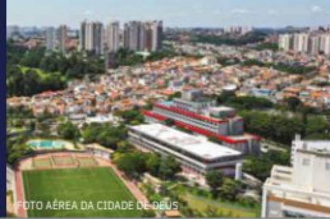
FOTO AÉREA DA CIDADE DE DEUS