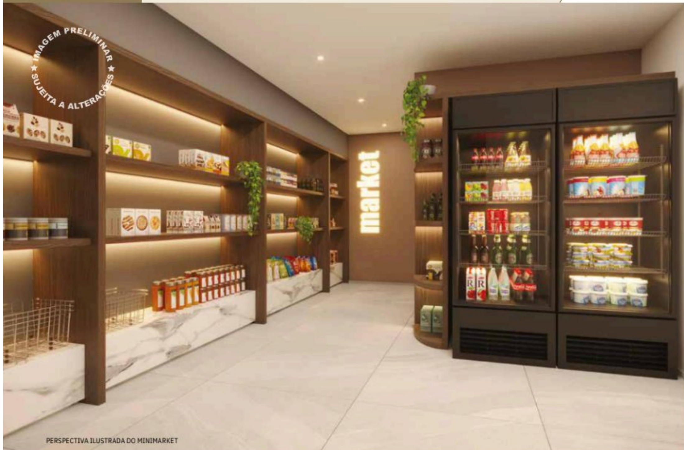
PERSPECTIVA ILUSTRADA DO MINIMARKET

Tudo o que você precisa com a conveniência de estar em casa.