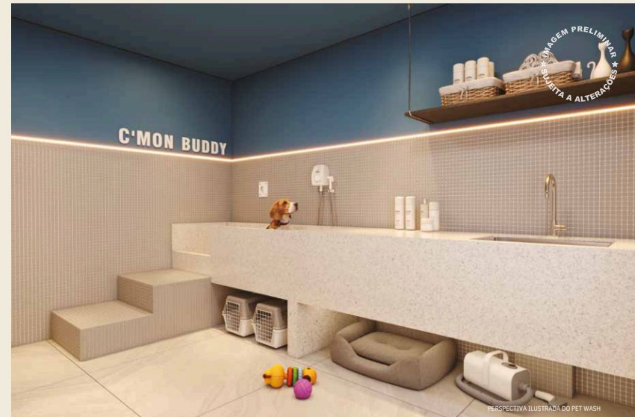
PERSPECTIVA ILUSTRADA DO PET WASH