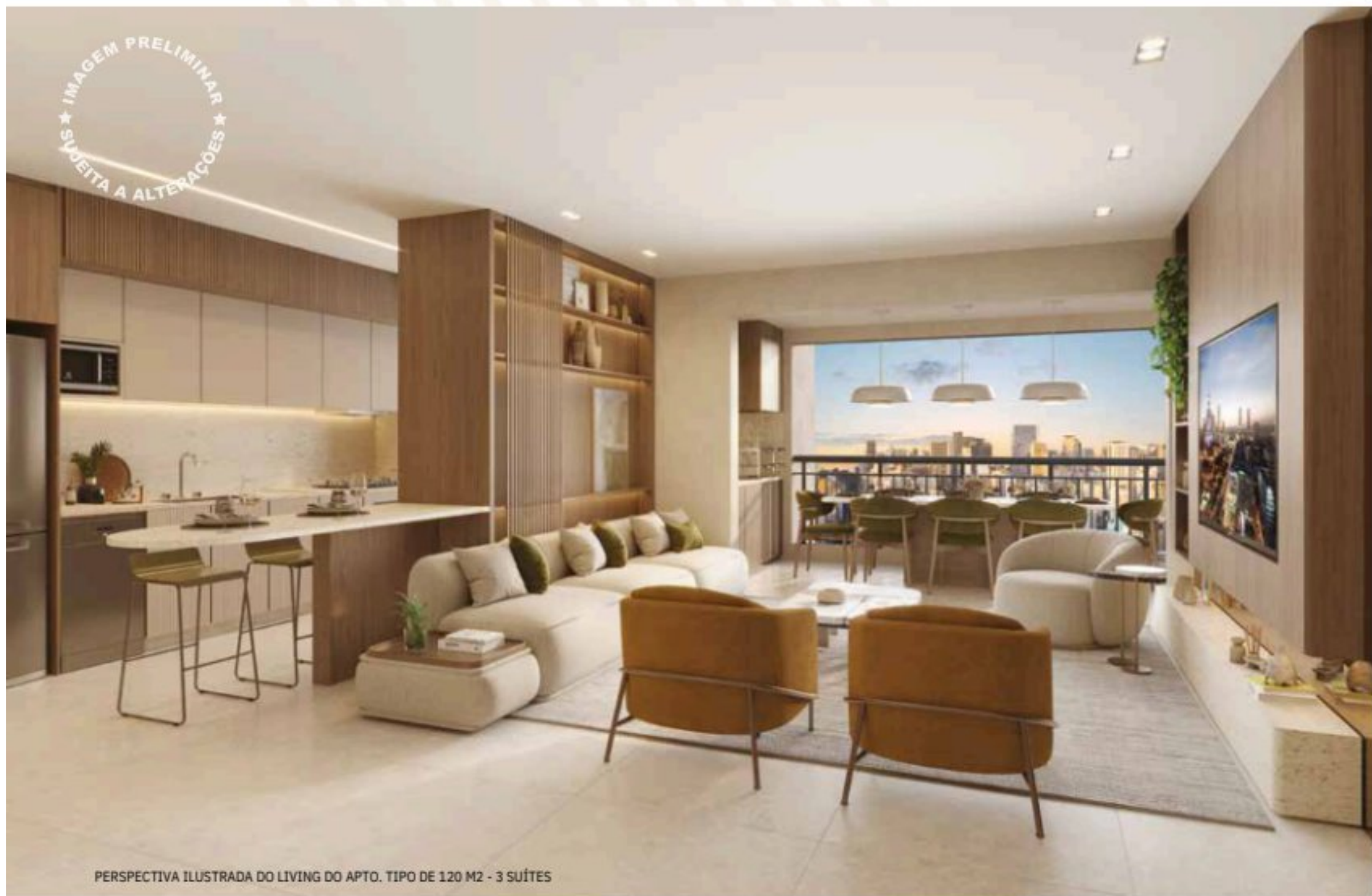
PERSPECTIVA ILUSTRADA DO LIVING DO APTO. TIPO DE 120 M 2 - 3 SUÍTES

SUGESTÃO DE DECORAÇÃO. EVENTUAIS ADEQUAÇÕES NAS INSTALAÇÕES ELÉTRICAS E/OU HIDRÁULICAS SERÃO POR CONTA DOS CLIENTES. QUALQUER MODIFICAÇÃO NO APARTAMENTO QUE IMPLIQUE NA ALTERAÇÃO DO PROJETO ORIGINAL DA FACHADA DEVERÁ SER APROVADA EM ASSEMBLEIA DO CONDOMÍNIO. SERÁ ENTREGUE CAIXILHO ENTRE O LIVING E TERRAÇO PELA INCORPORADORA.