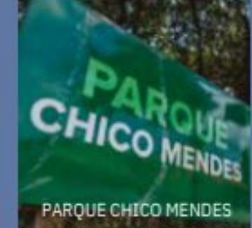
PARQUE CHICO MENDES